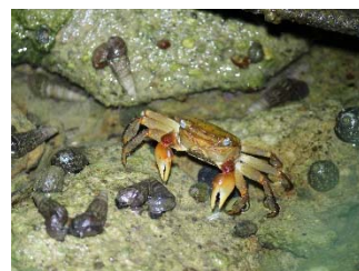
講演①循環の象徴・アカテガニ (九十九湾)