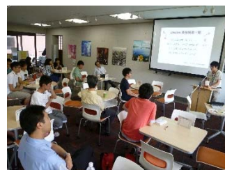
講演②ビブリオバトルの様子